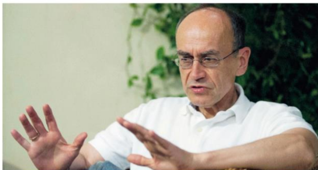
Thomas Südhof vinse, con Randy Schekman e James Rothman, il Nobel per la medicina e la fisiologia

Il premio Nobel Thomas Südhof era a Bellinzona per incontrare i ricercatori dell'Istituto di ricerca in biomedicina e la popolazione