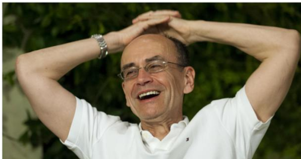
Premio Nobel per la medicina nel 2013

Venerdì 26 aprile alle 18 Thomas Südhof prenderà parte alla serata evento "La salute cerebrale: Dialogo tra neuroscienze e filosofia"